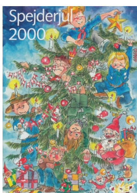
Første og sidste udgave af Spejder Jul

Der var lagt mange årgange af Spejderjul på bordene til gennemsyn eller måske gensyn for nogle.